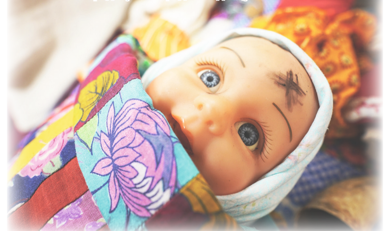
Крестик, нарисованный углём из печи, обозначал передачу силы рода младенцу