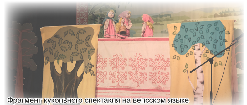
Фрагмент кукольного спектакля на вепском языке