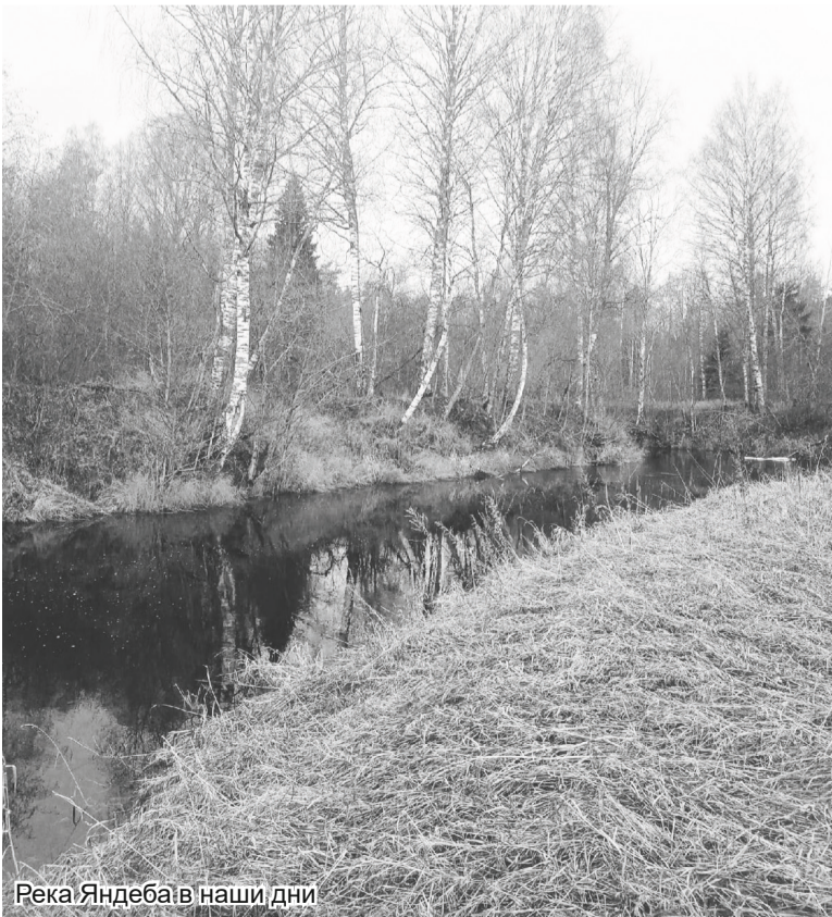
Река Яндеба в наши дни