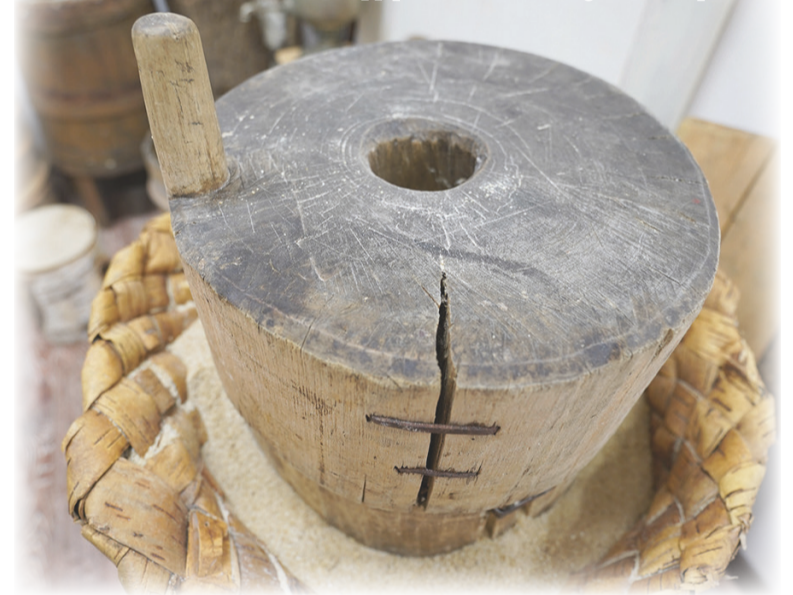
Деревянный действующий жернов

помол, поэтому толокно пропускают через жернова несколько раз. Впрочем, дети часто едят толокно прямо из-под жерновов и говорят, что по вкусу оно похоже на попкорн...»