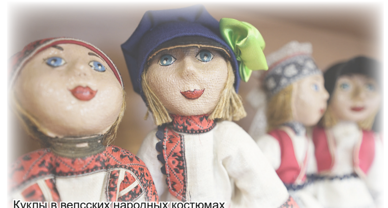
Куклы в вепских народных костюмах