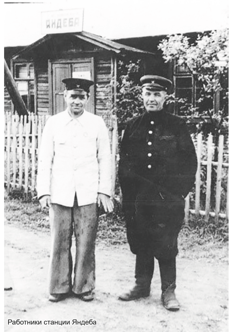
Работники станции Яндеба

Период раскулачивания и дальнейших политических репрессий не обошёл стороной и поселение Яндеба. К настоящему времени удалось установить имена местных жителей, которые были расстреляны, отправлены в тюрьмы и лагеря, их семьи высланы в Сибирь на поселение. Их имущество и дома были конфискованы и национализированы. Некоторые семьи, чтобы не попасть в списки